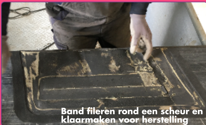
Band fileren rond een scheur en klaarmaken voor herstelling