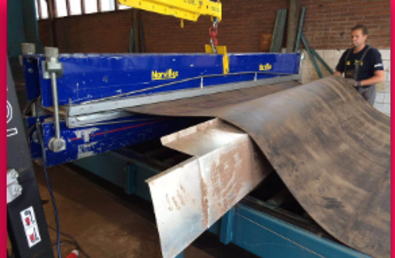
Lassen van Kunststof Banden tot breedte 3.200 mm