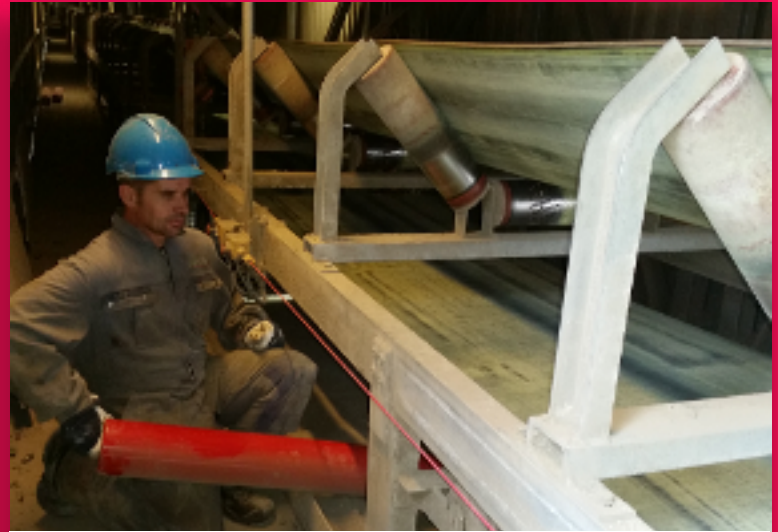
Vervangen van draagrollen en COPS onderhoud