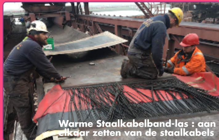
Warme Staalkabelband-las : aan elkaar zetten van de staalkabels