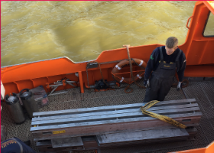
Specialisatie in werken in Maritieme Omgevingen