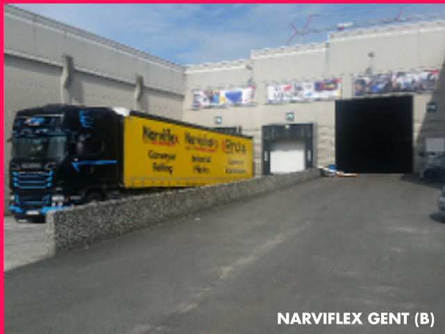
NARVIFLEX GENT (B)

Narviflex Belting Liège SA Rue de la Bureautique 8 B-4460 Grâce-Hollogne Tel : +32 4 228.82.20 Fax : +32 4 289.14.89 E-Mail : info@narviflex.be