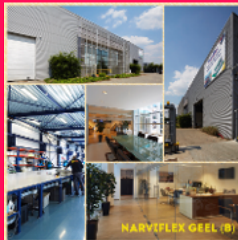
NARVIFLEX GEEL (B)