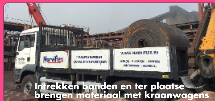
Intrekken banden en ter plaatse brengen materiaal met kraanwagens