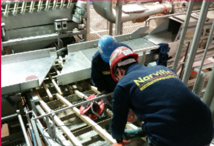
Bedrijfsklaar maken van installaties