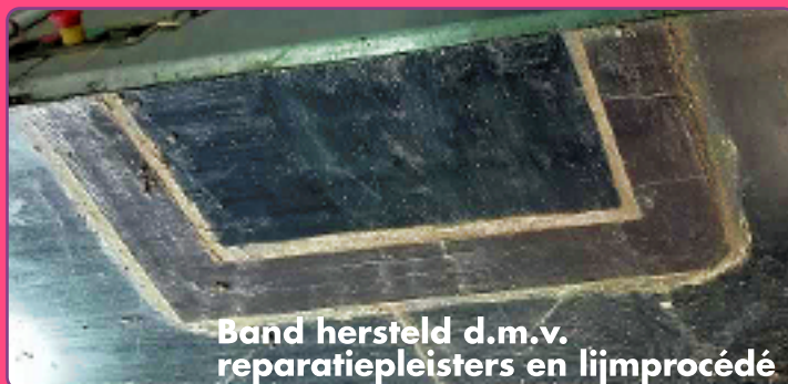
Band hersteld d.m.v. reparatiepleisters en lijmprocédé

Graag beoordelen we samen met u of een band te repareren valt (dikwijls is dat zo), of dat vervanging aangewezen is.