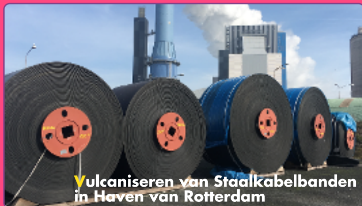
Vulcaniseren van Staalkabelbanden in Haven van Rotterdam